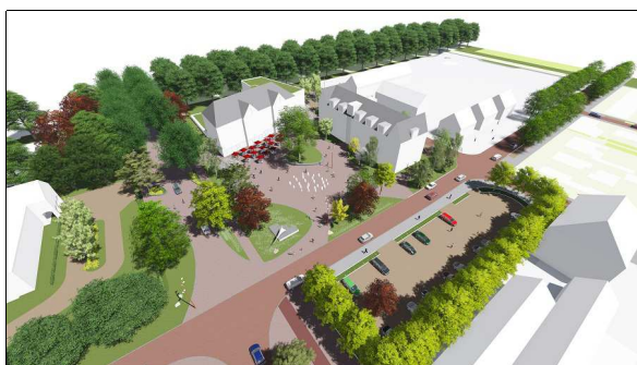
B. De Groen Campus