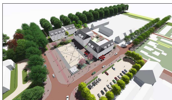
C. De Dorpskamer