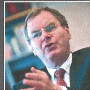
Zwarte cijfers dragen het meeste bij aan duurzaamheid