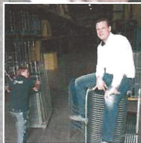
Jonge Soester ondernemer succes- vol in evenementenbranche