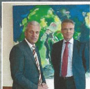
Rabobank zorgt voor slimmere klantbediening